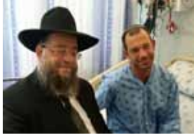
26 מהפכת החיים בעיצומה