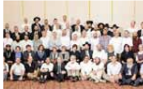
30 שבת תרומה