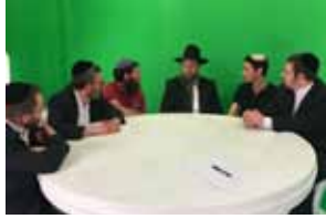
14 שולחנם של מלאכים