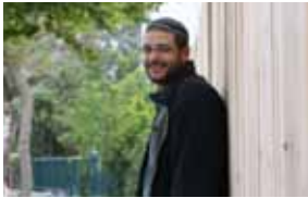
58 שפע של חסד