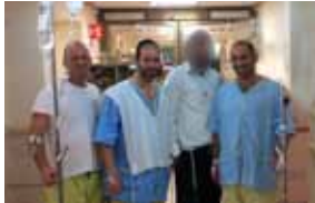
36 ארבעת המופלאים