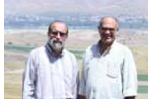
04 למען אחי ורעי