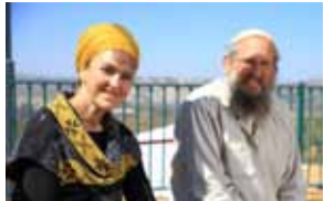
52 נתינה זוגית