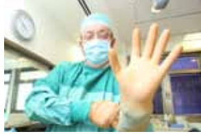
20 הפרופסור מציל חיים