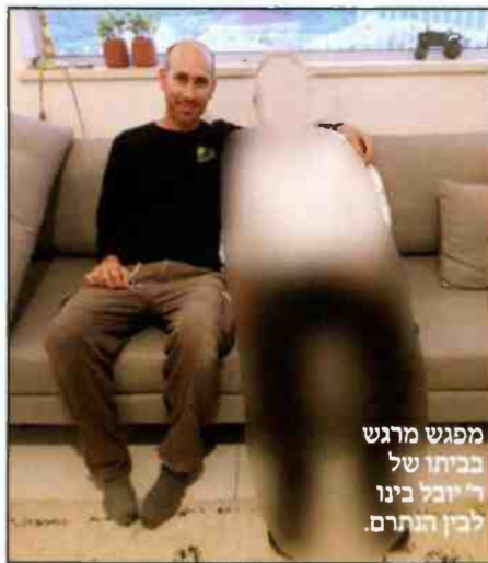
מפגש מרגש בביתו של ר' יובל בינו לבין הנתרם.