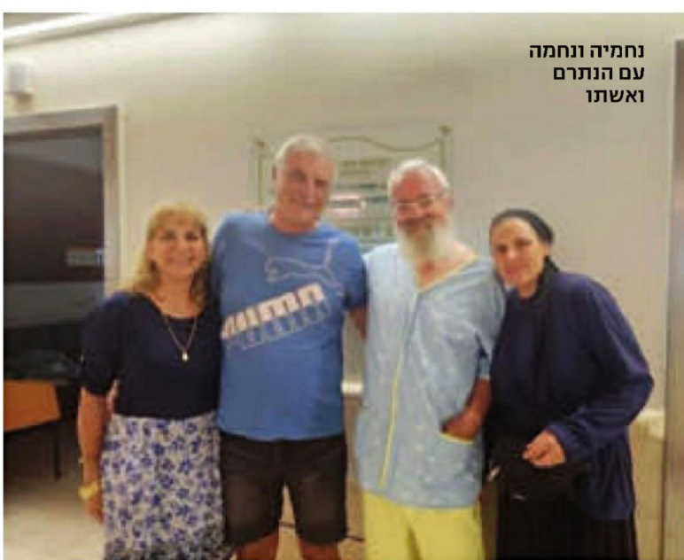
נחמה ונחמה עם הנתרם ואשתו

נחמה: "זה לא מעשה מטורף, זה מעשה אנושי, סביר, הגיוני, מועיל, תורם, ומרוויחים ממנו".