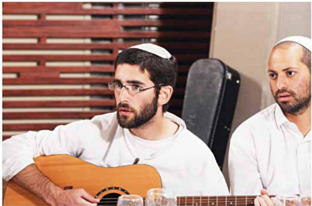
"הוא ניגן את הנשמה"

רחל'ה: "היינו בהחלטה שאנחנו מקווים ומתפללים שיצא מזה. יש לנערך כוחות, והיה לי חשוב לשרד לכר לם אנרגיות של חוזק וכוח. כל הזמן קיוויתי, המיינתי אותו מתרומם ומחייה. הרגשתי שזה לא הגיוני ולא יכול להיות שהוא לא יקום. יש לו עוד כל כך הרבה מה לעשות, יש עוד כל כך הרבה אנשים שזקוקים לו. זה אדם שחי את החיים הכי מלאים בעולם, זה לא מסתדר עם מוות והידלוק".